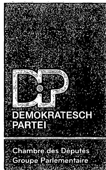
Gusty GRAAS Député

9, rue du St. Esprit B.P. 510 L-2015 Luxembourg