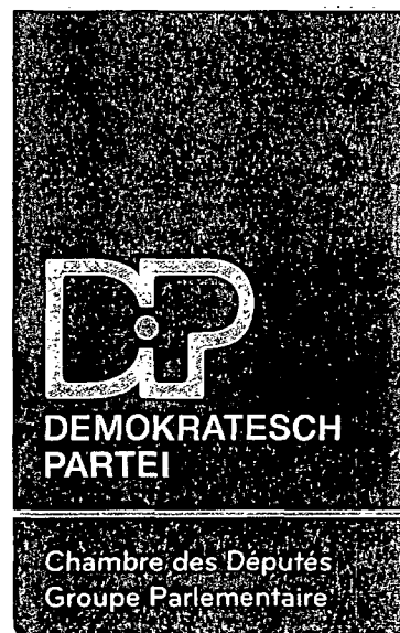
André BAULER Député

9, rue du St. Esprit B.P. 510 L-2015 Luxembourg