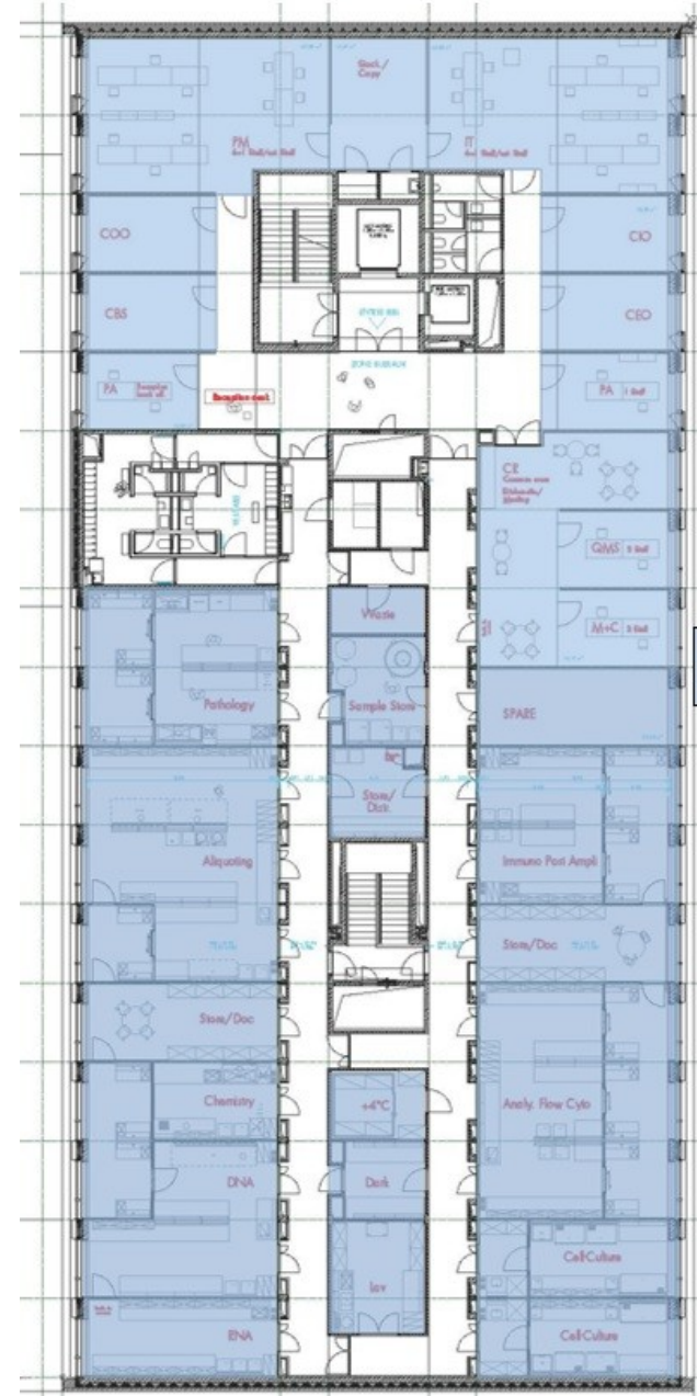
Modification IBBL 2015