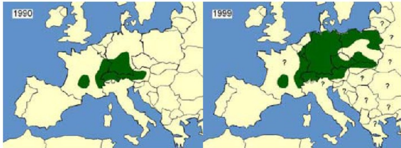
Infektion der Füchse mit E. multilocularis in Europa, aus Daten von EurEchinoReg über ungefähre Verteilung in 1990 und in 1999