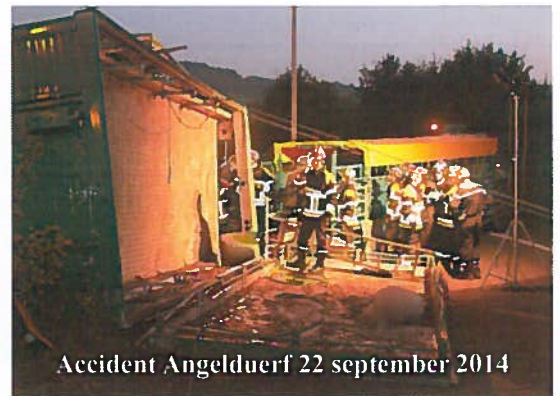
Accident Angelduerf 22 september 2014