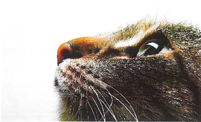
Das tot aufgefundene Tier wies Spuren von Misshandlung auf.

Veröffentlicht am Mittwoch, 11. Juni 2014 um 19:04