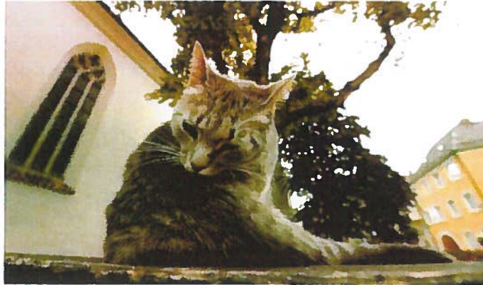
Zu Schieren ass der Police no eng jonk Kaz mësshandelt ginn.

Déi ass op der Sich no Zeien, well d'Kaz mësshandelt gouf, wéi se an hirem Bulletin schreift.