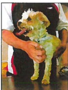
Diesem Hund geht es wieder nach einem ärztlichen Besuch besser. Der Vierbeiner wurde am Dienstag in einer Mülltonne in Esch/Alzette gefunden und ins Escher Tierasyl gebracht.

Oft werden sie von ihrem Herrchen oder Frauchen in Tierasylen abgegeben. Andere werden einfach auf Autobahnen oder Parkplätzen ausgesetzt. Wie das Escher Tierasyl Tageblatt.lu mitteilte, wurde am Dienstag ein Bichon Maltais (siehe Foto) lebendig in einem Mülleimer in der Escher Grand-Rue aufgefunden. Der Hund wurde sofort zum Tierarzt gebracht. „Vor allem in der Ferienzeit werden viele Vierbeiner bei uns abgegeben oder einfach ausgesetzt“, so eine Verantwortliche des Escher Tierasyls.