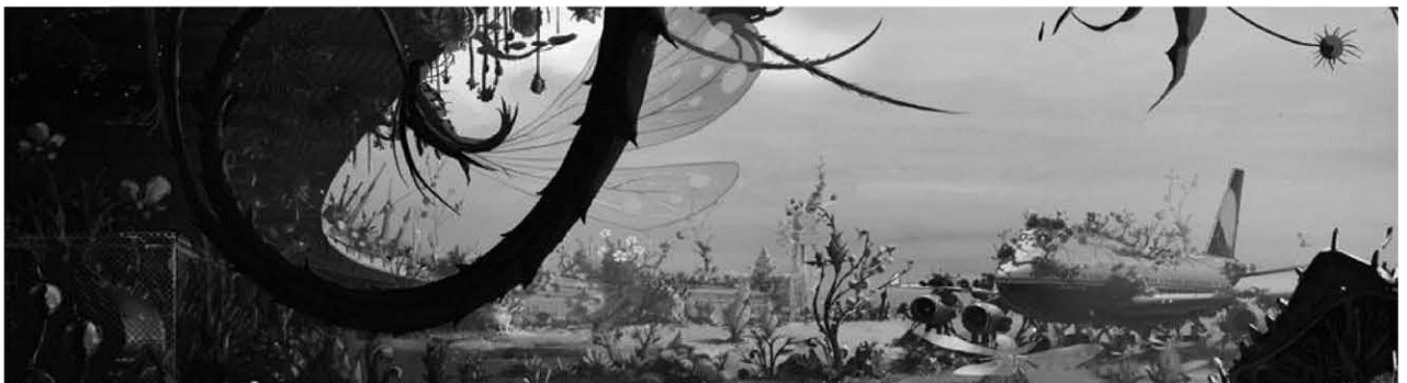
The Congress , dir. Ari Folman

2004 - T'Choupi - le film , dir. Jean-Luc François, prod. Les Armateurs, Melusine Productions Design, Layout posing and background, 2D traditional animation