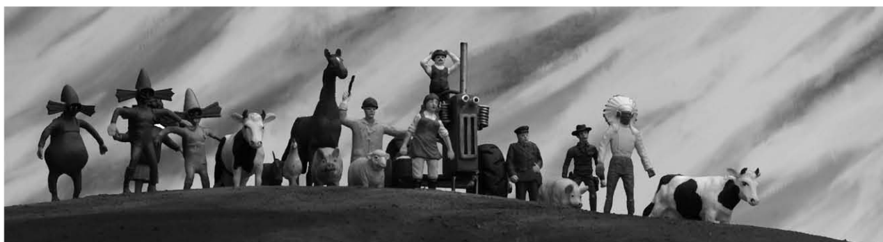
Panique au village , dir. Stéphane Aubier & Vincent Patar

XII edition International film festival Granada Spain Award winner for the best short film XII edition International film festival Granada Spain Award winner for the best Director VI Semena Internacional de Cine fantastico y de Terror Estepona, Spain, Award winner for the best short film Art Futura Barcelona Spain Special Jury Award winner Animacor Cordoba Spain, Award Winner for the best audiovisual work Animadrid Madrid Spain Award winner for the best spanish animated film Miami Short film festival, Miami USA, Award Nominee for the best animated short