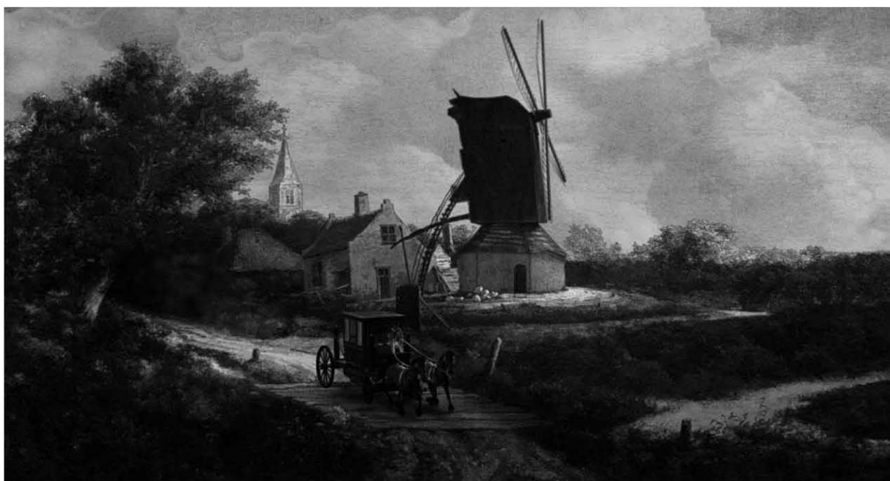
Vauban , dir. Pascal Cuissot

2009 - Les lettres de Julia , dir. Isabelle Constantini, prod. Tarantula 3D animation, FX and compositing