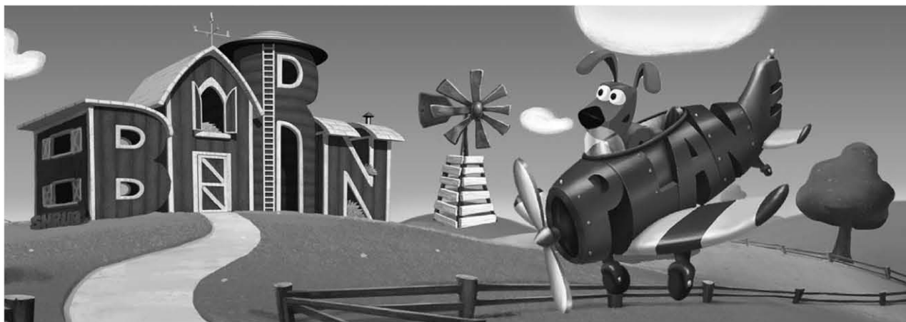
Word World, 65x9'

Daytime Emmy Awards, Award Winner for Outstanding Children's Animated Program