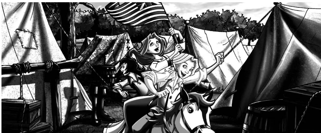
Liberty's Kids , 40x26'