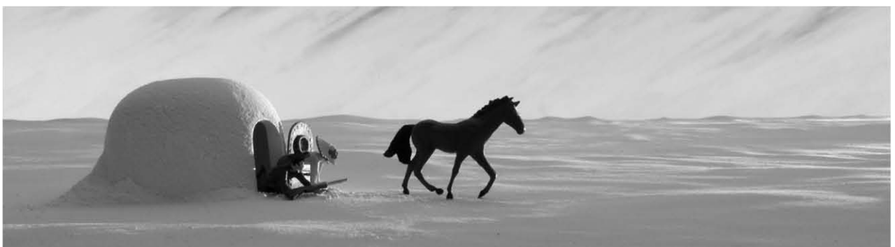
Panique au village , dir. Stéphane Aubier & Vincent Patar

XII edition International film festival Granada Spain Award winner for the best short film XII edition International film festival Granada Spain Award winner for the best Director VI Semena Internacional de Cine fantastico y de Terror Estepona, Spain, Award winner for the best short film Art Futura Barcelona Spain Special Jury Award winner Animacor Cordoba Spain, Award Winner for the best audiovisual work Animadrid Madrid Spain Award winner for the best spanish animated film Miami Short film festival, Miami USA, Award Nominee for the best animated short