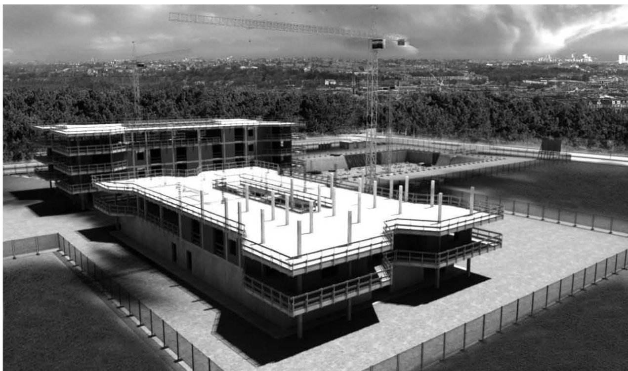
IM-Safe project , IFSB

2008 - Mecalac , prod. IFSB, Studio 352 Interactive virtual simulation, Complete 3D production