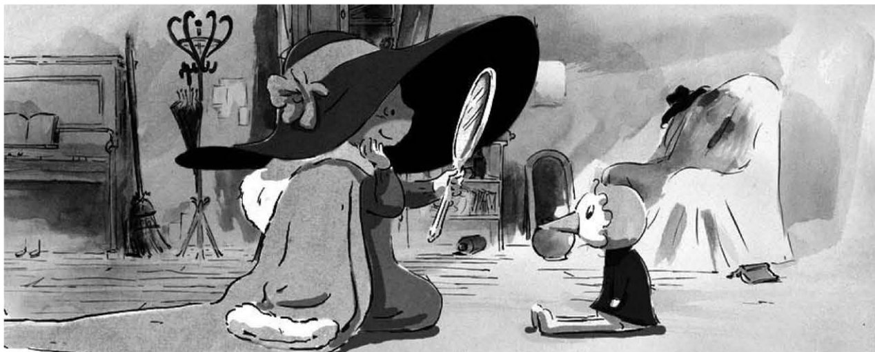
Ernest & Célestine , dir. Benjamin Renner, Stéphane Aubier & Vincent Patar

2004 - T'Choupi - le film , dir. Jean-Luc François, prod. Les Armateurs, Melusine Productions 2D traditional animation