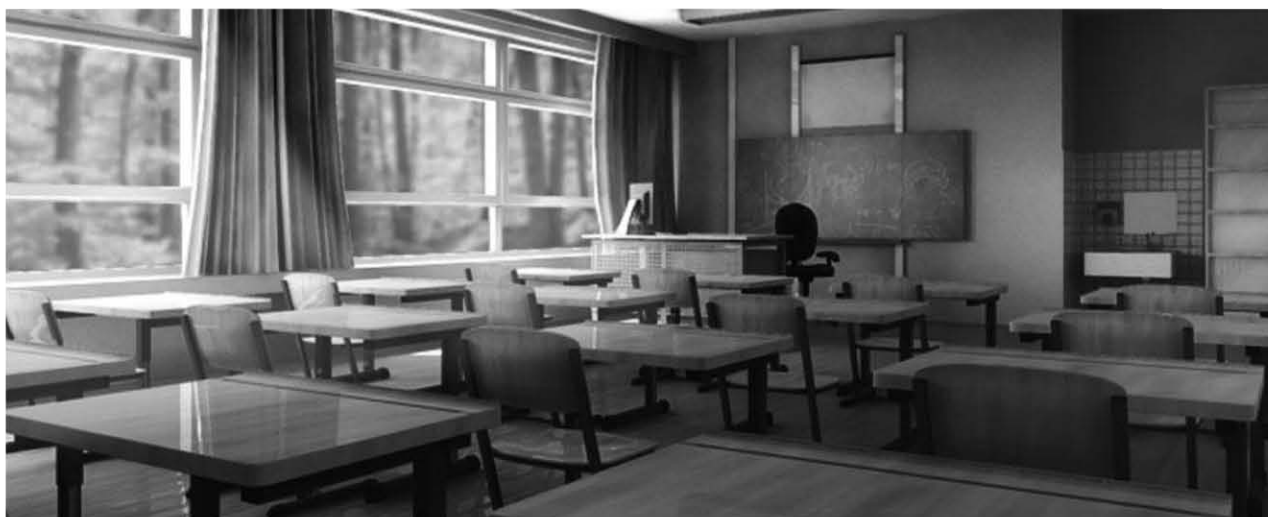
Mini Book , 3D main interface

Complete video production, intern posters ad campaign