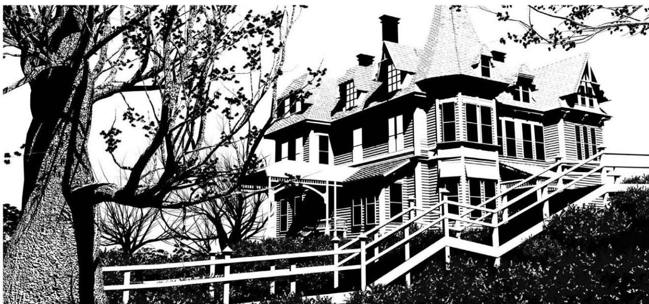
The Tell Tale Heart, dir. Raul Garcia

A night of Horror Shorts Film Festival, Sydney, Australia, Award Winner for best Animation Short