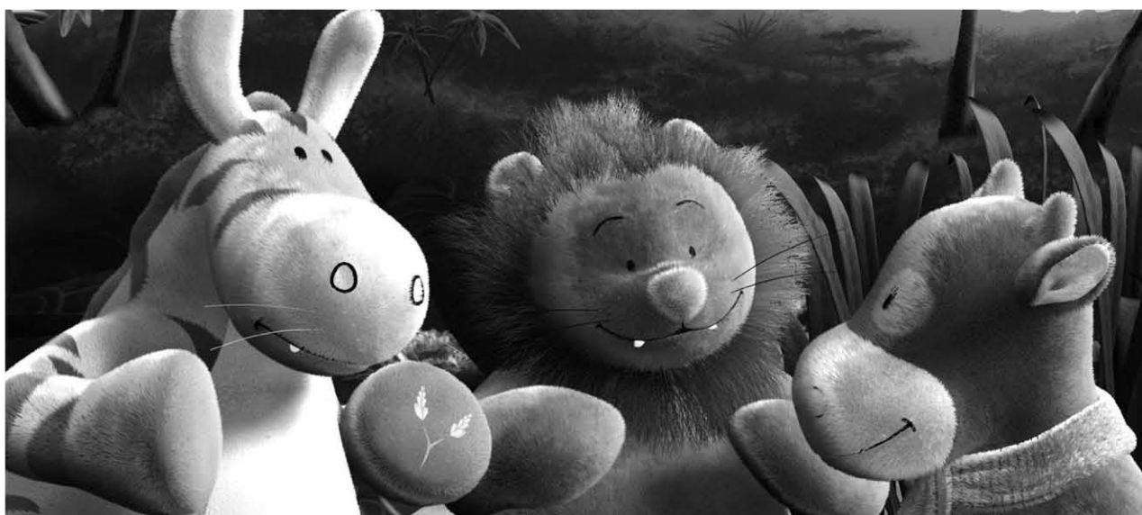
Paco, Nouky & Lola , 52x5'

2006 - Strawberry Shortcake , 4x26', prod. DIC Entertainment Design and color models, Storyboard