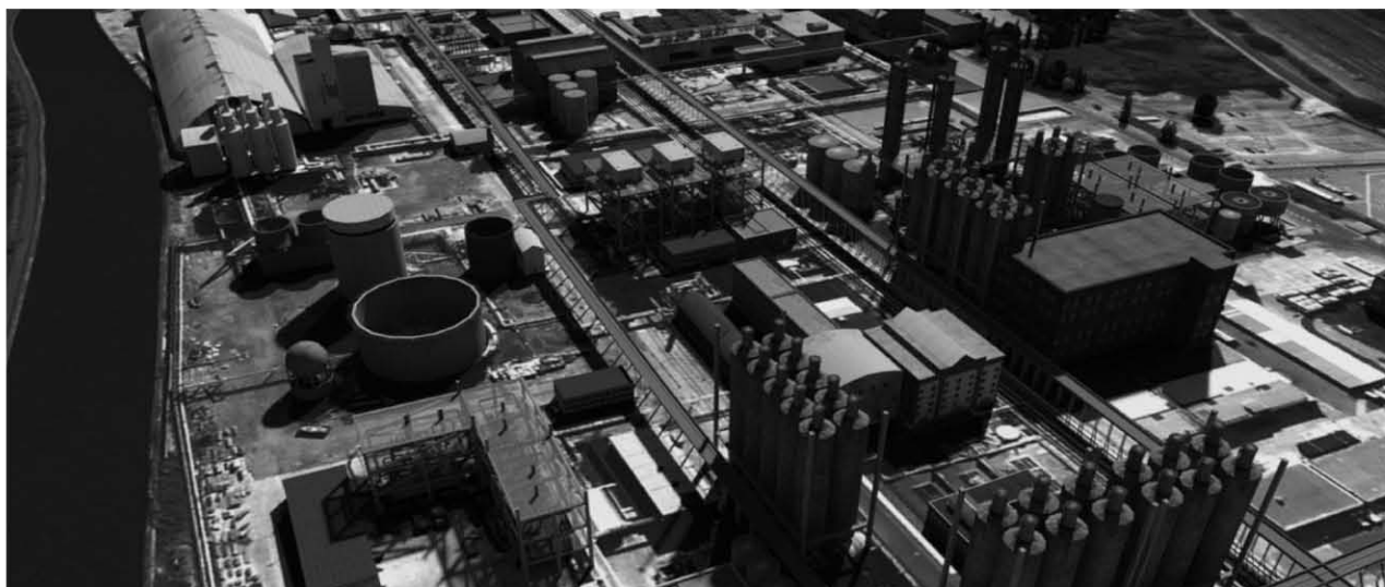
Seveso Site, Solvay

1999 - Freialand 5' ad , prod. Studio 352 Complete production