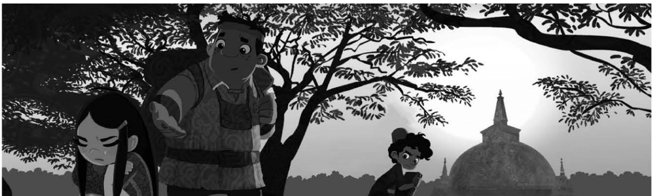
The Adventures of Young Marco Polo , 26x25'

2010 - Bummi , 20x2'30, prod. Studio 88 Storyboard