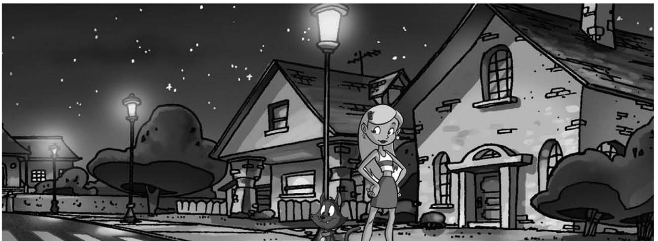
Sabrina , 26x26'

1997 - The Tex Avery Theater Show , 26x26', prod. DIC Entertainment Complete pre-production, Layout posing and background