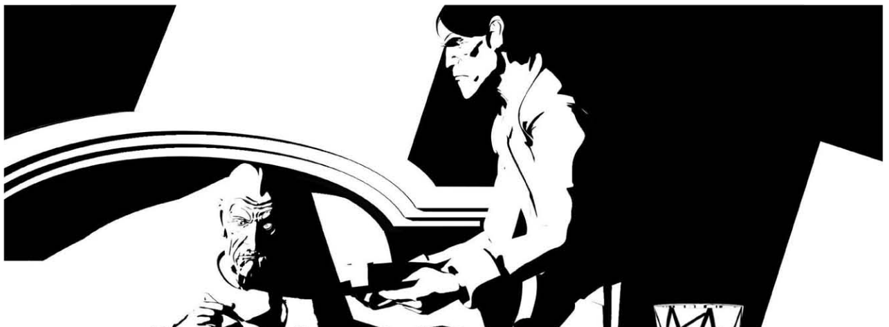
The Tell Tale Heart , dir. Raul Garcia

2008 - Nouky & Friends , Season 2, 52x5', prod. Noukies Pictures/Amtoys, Melusine Productions, Les Armateurs 3D animation