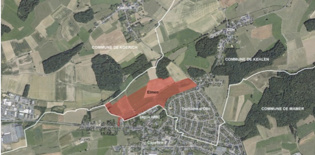
Situation du site de projet

Le site du projet est jouté à l'est par le "Domaine d'Olm" situé sur le territoire de la commune de Kehlen et au sud par la localité de Capellen située sur le territoire de la commune de Mamer. Le nord-ouest du site est couvert de champs et de forêts.