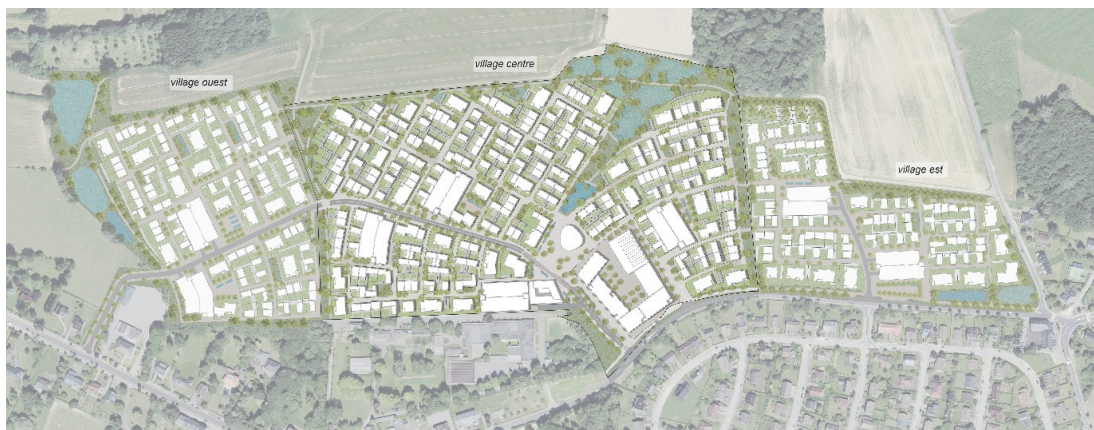
Plan masse général du projet ELMEN et des trois villages