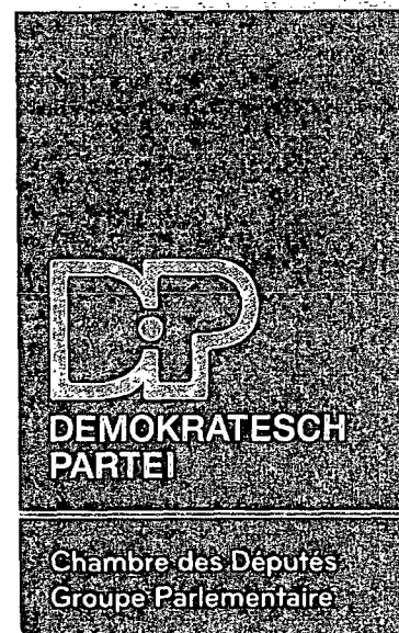
Claude LAMBERTY Député

9, rue du St. Esprit B.P. 510 L-2015.Luxembourg