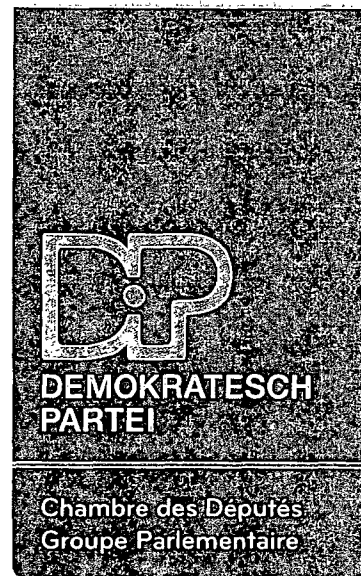
Edy Mertens Député

9, rue du St. Esprit B.P. 510 L-2015 Luxembourg