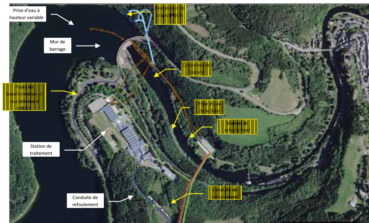
Annexe 1: Équipements existants (blanc) et les nouveaux équipements (jaune) à Esch-sur-Sûre

Annexe 1 : Photo aérienne des équipements existants et des nouveaux équipements à Esch-sur-Sûre