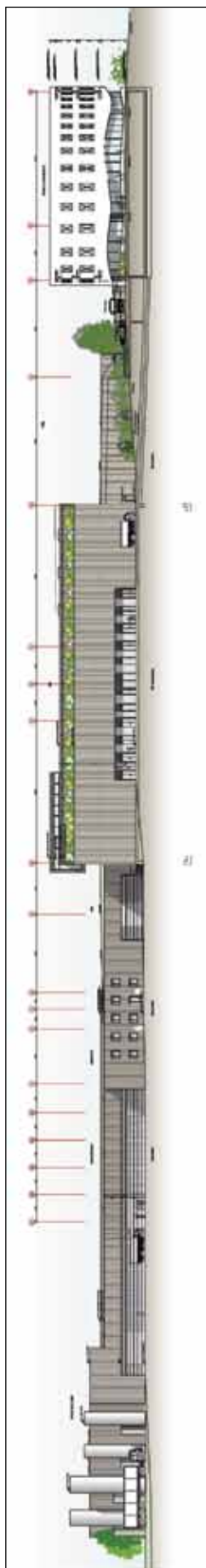
Annexe 4 : Vue sud-est sur la station de traitement avec bâtiments connexes