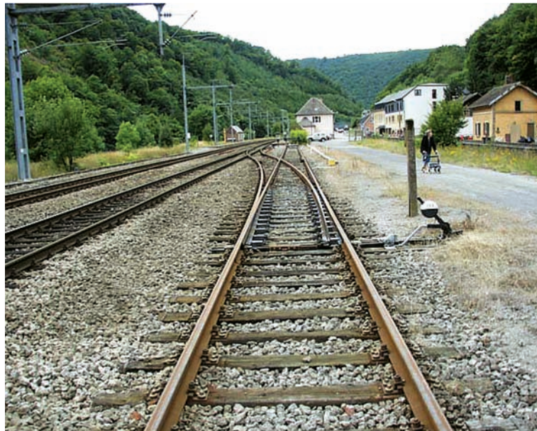
Ligne du Nord près de la Gare de Goebelsmuhle